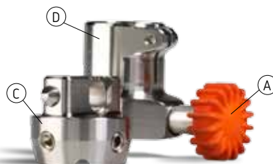
Posizione aperta e divisa